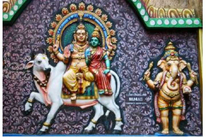
தாய் தந்தையுடன் மகன் பிள்ளையார்