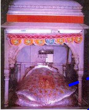
சுயம்பு பிரேத சர்கார்

(ஓம் சரவணபவ, ஏப்ரல், 2006 இதழில் வெளியான இந்த கட்டுரையின் விரிவாக்கப்பட்ட மறு பதிப்பு இது )